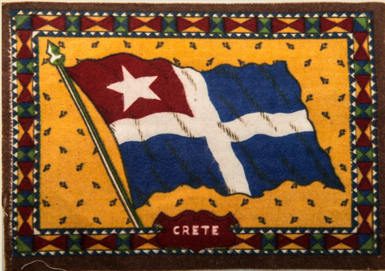
Σημαία της Κρητικής Πολιτείας (1898-1913)