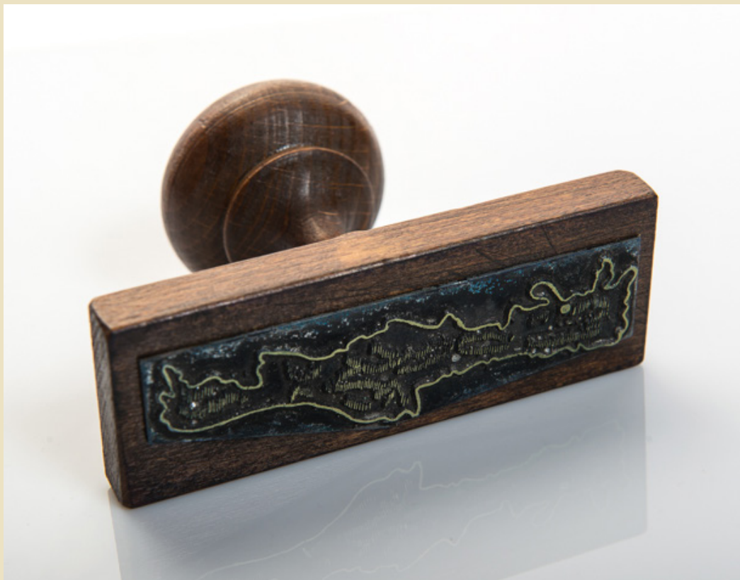
Εύλινη σφραγίδα της εποχής με το περίγραμμα της Κρήτης