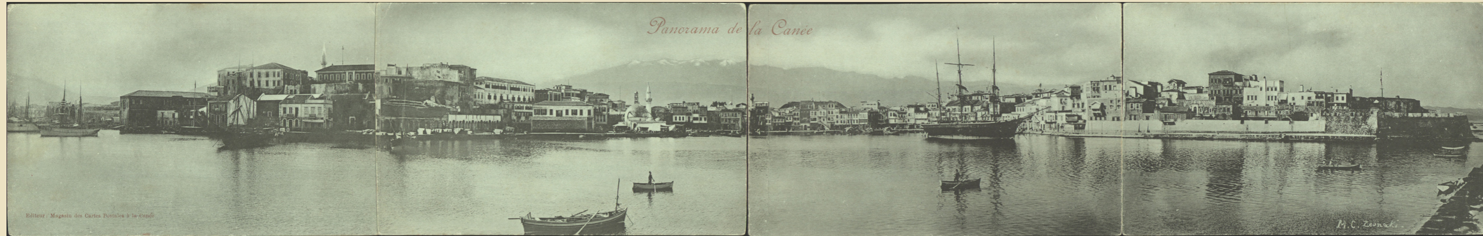
Σπάνιο τετράπτυχο ταχυδρομικό δελτάριο με το λιμάνι των Χανίων