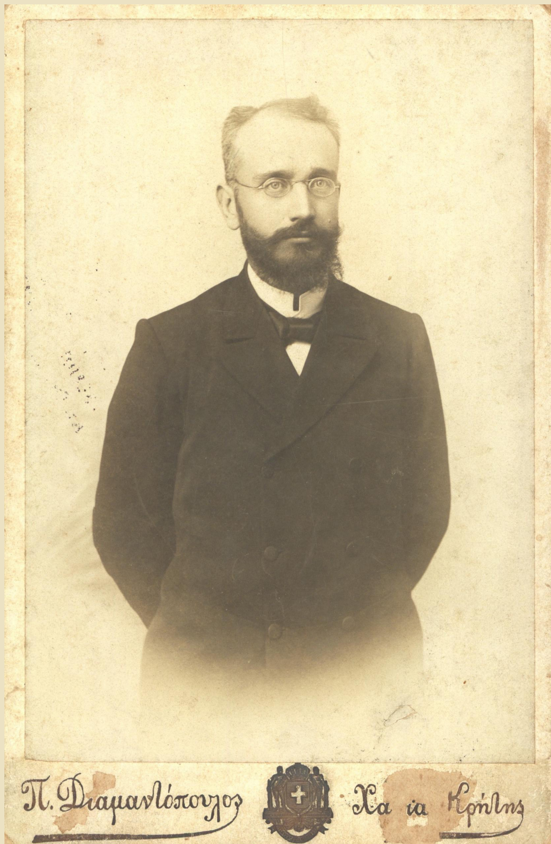
Χονδροκάρτα της εποχής με τον Ελευθέριο Βενιζέλο την περίοδο της Κρητικής Πολιτείας